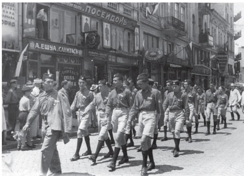
Слика 6. Соколи Смедерева у соколском дефилеу, Софија, 1939.

Крајем двадесетих и почетком тридесетих година 20. века, када је соколство било изузетно снажно на свим пољима свога деловања, почеле су се прихватати нове спортске активности у физичком вежбању и такмичењима. У Смедереву је одувек владао спортски дух, тако да су лако