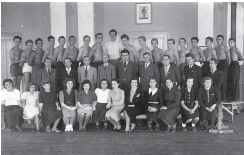
Слика 7. Соколско друштво Смедерево, део соколског чланства 1940.