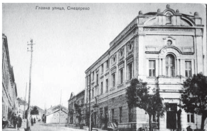
Слика 3. Соколски дом у згради Задужбине на првом спрату

Коцас да би се превазишли финансијски проблеми. Филмови су пројектовани са балкона сале, а приходи су коришћени за набавку биоскопског инвентара, филмова и плаћање коришћења и одржавања соколане. На првом спрату Задужбине, соколски дом је имао пространу главну и помоћну салу за вежбање, пратеће просторе, соколску књижницу и читаоницу. У соколани, поред вежбања, приређиване су игранке, јавни часови, посела, организоване су лутрије, скупљање добровољних и хуманитарних прилога на соколским вечерима.