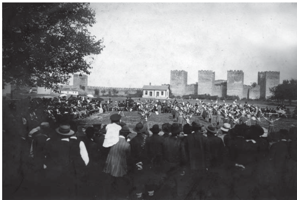
Слика 1. Соколски слет у Смедеревској тврђави, 1914.