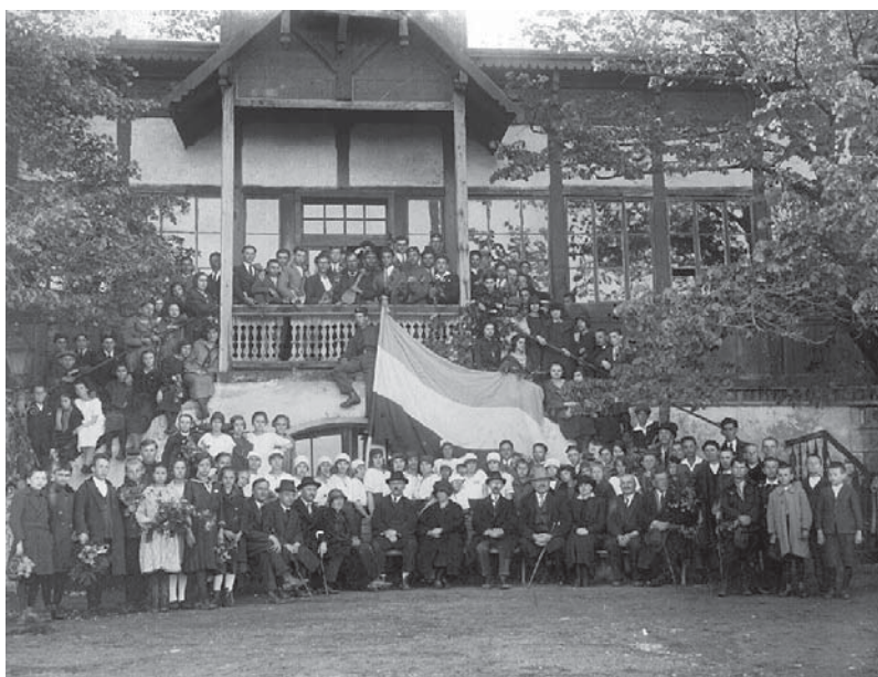
Слика 2. Уранак смедеревских сокола, испред Виле Обреновића, 1924.