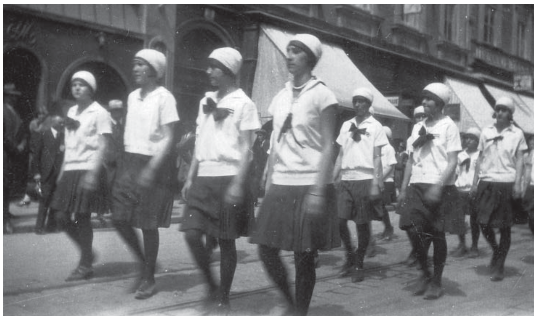
Слика 4. Државне првакиње нараштајке из Смедерева, Суботица 1936.

Поред окружних, нараштајских и жупских слетова, смедеревски соколи су учествовали од 1926. на готово свим највећим слетовима (Брозовић, 1930; 1935). То су: 8. свесловенски слет у Прагу (1926), 6. покрајински соколски слет у Скопљу (1928), Први свесоколски слет Краљевине Југославије у Београду (1930), 1. покрајински слет у Љубљани (1933), 2. покрајински слет у Сарајеву (1934), 3. покрајински слет у Загребу (1934) и 8. слет Бугарских Јунака у Софији (1935) (Цветковић, 2007). Посебно је занимљив 4. покрајински слет у Суботици (јун 1936) на коме је одељење женског нараштаја за освојено 1. место и титулу државног првака одликовано сребрним венцем Београдске жупе (Годишњи извештаји за Главну скупштину о раду Соколске жупе Београд за 1937. годину). Смедеревске нараштајке су, због великог успеха на савезном слету, представљале југословенско соколство наредне године на академијама које су приређене у Београду на Коларцу и Софији у Народном позоришту (1937).